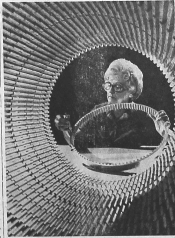
HANIM GÖREVLİ İŞ BAŞINDA — Goodyear

Konservecilik çalışmalarının aralıksız olarak sürdürüldüğünü söyleyen ilgililer, yakında sebzenin yanında meyve konservesi yapımına da gireceklerini belirtmişlerdir.